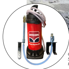
Optional: Staubunterdrückungs-Kit, Artikelnr. 1113286 HYCON Wasserbehälter, Artikelnr. 3030051

Für weitere Informationen wenden Sie sich bitte an: hycon@hycon.dk