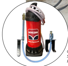
Optional: Staubunterdrückungs-Kit, Artikelnr. 1113286 HYCON Wasserbehälter, Artikelnr. 3030051

Für weitere Informationen wenden Sie sich bitte an: hycon@hycon.dk