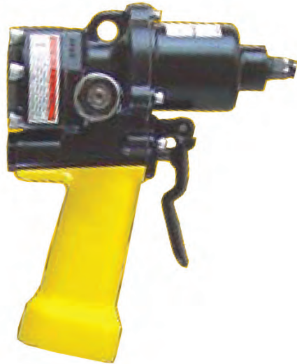
ID07 Model with 1-1/2" square drive for impact sockets